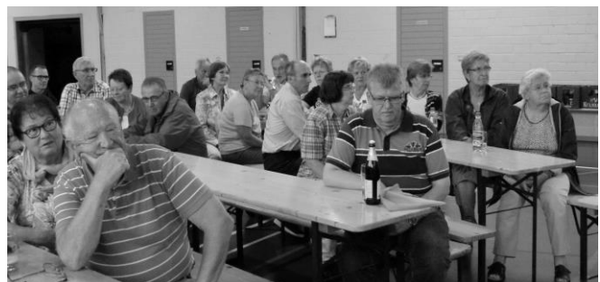
Ein Teil der teilnehmenden Stillen Gesellschafter