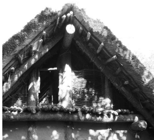
nach dem Diebstahl

Am 7. September haben wir festgestellt, dass unser Langhaus auf dem Schulgelände beschädigt und bestohlen worden ist: